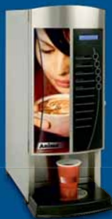
◀ OptiVend 1 / 2

Über das Operatormenü können die Rezepte genau nach Ihrer Wahl eingestellt werden. Auch die Dosiermenge pro Tasse, Becher oder Kanne können Sie nach Ihren persönlichen Wünschen programmieren. Über eine Geheimzahl werden Ihre Einstellungen gespeichert und damit auch gesichert.