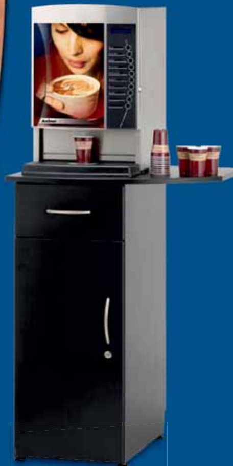
Unterschrank mit zusätzlicher Abstellfläche