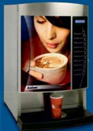
OptiVend 3 / 4 (TS) ▶